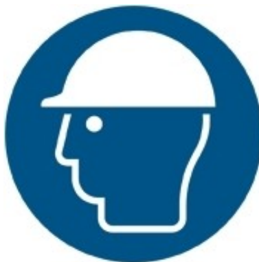
M014 - Indossare casco di protezione