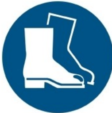
M008 - Indossare calzature di sicurezza