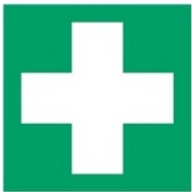
E003 - Pronto soccorso