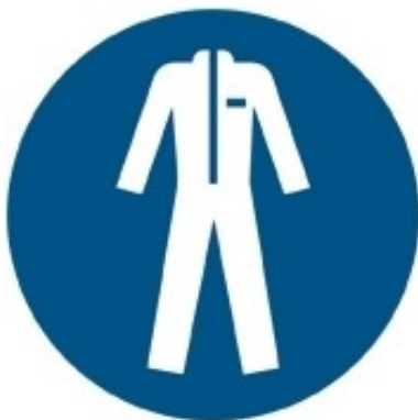
M010 - Indossare indumenti protettivi