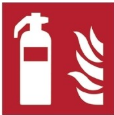
F001 - Estintore