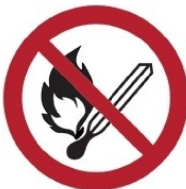
P003 - Vietato usare fiamme libere