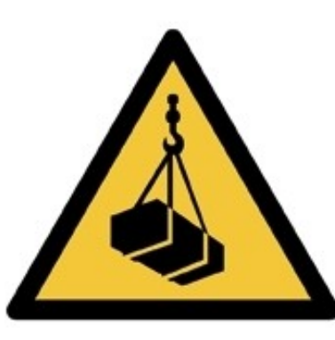
W015 - Carichi sospesi