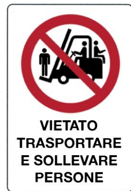
Vietato trasportare e sollevare persone