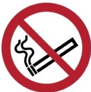
P002 - Vietato fumare