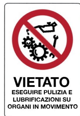
Vietato eseguire pulizia, riparazioni e lubrificazioni su organi in movimento