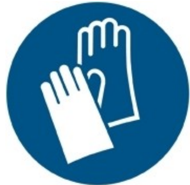
M009 - Indossare guanti protettivi