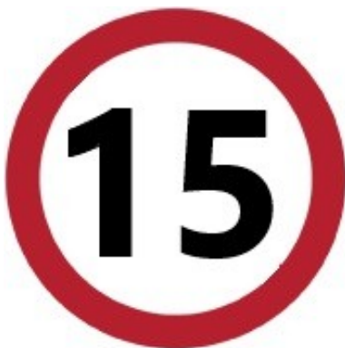
Velocità massima in cantiere di 15 km/h