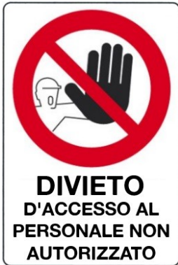
Divieto d'accesso al personale non autorizzato